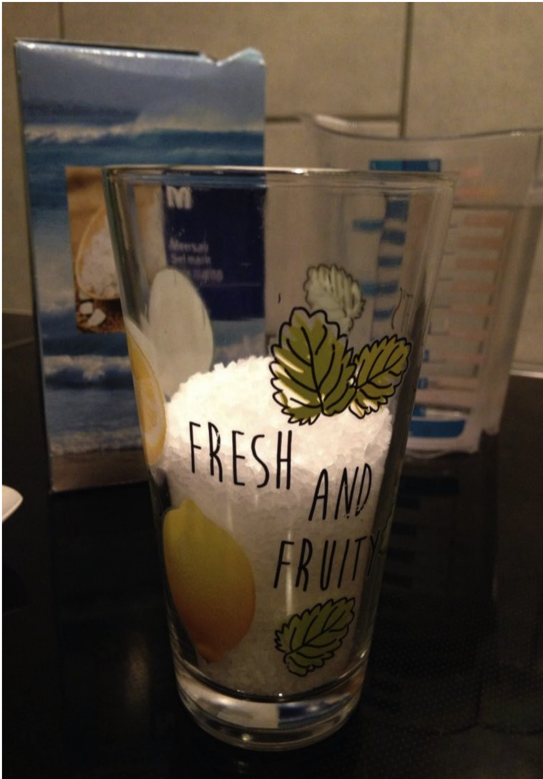
Illustration 2: Verre rempli de gros sel jusqu'à la moitié

1 ère étape: Remplir le verre de sel jusqu'à la moitié de sa contenance. Il vous faut 1 verre par pièce. Et pour les pièces ouvertes de type: couloir, cuisine, salle à manger, il vous faudra 3 verres ( 1 dans le couloir, 1 dans la cuisine, 1 dans la salle à manger).