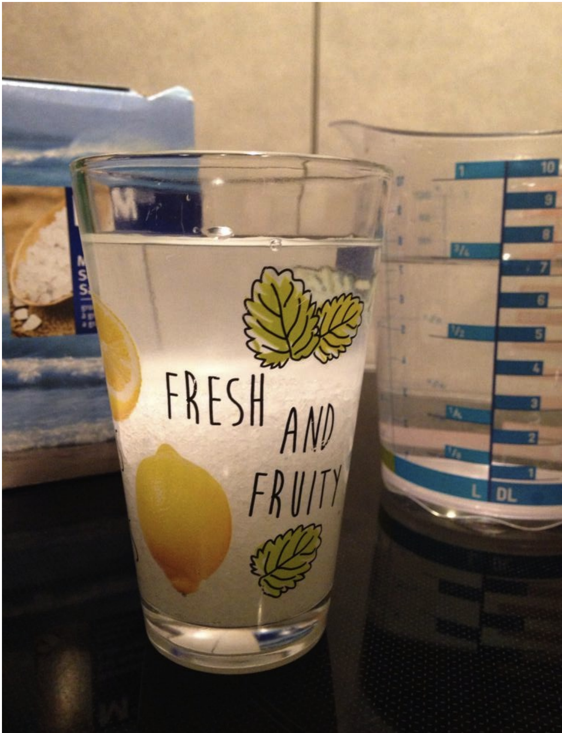
Illustration 3: Verre rempli d'eau jusqu'à 1cm du bord

2ème étape : Compléter avec de l'eau du robinet jusqu'à 1cm du bord du verre