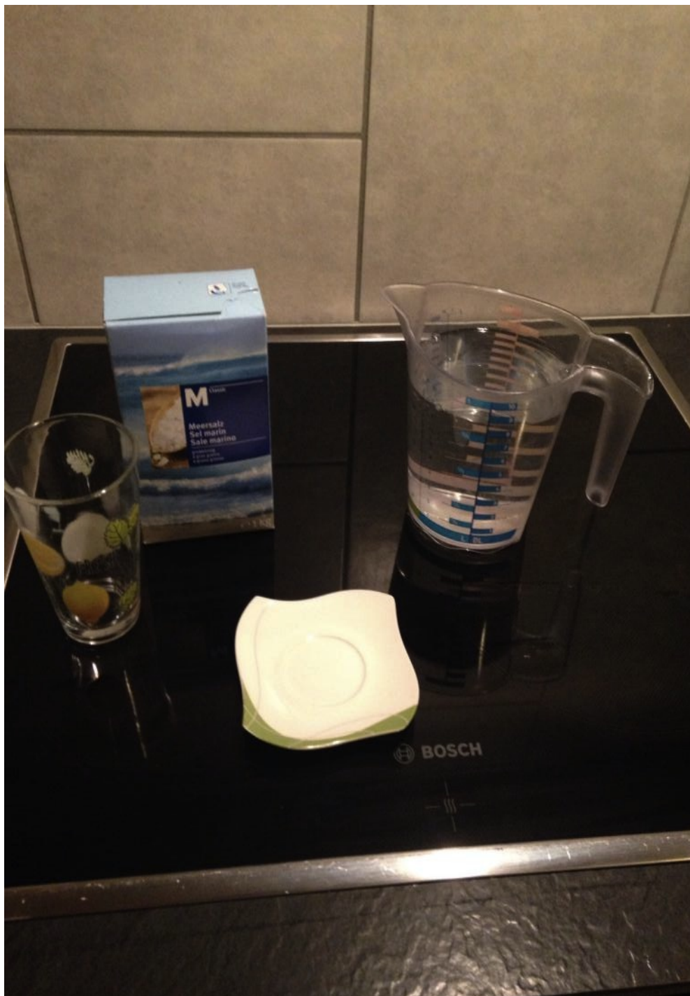
Illustration 1: Ingrédients: verre, sel marin, soucoupe et eau

Verres en verre, un par pièce ( attention lors de la première cure, ils seront jetés), sel marin (gros grain si possible), une soucoupe, de l'eau.