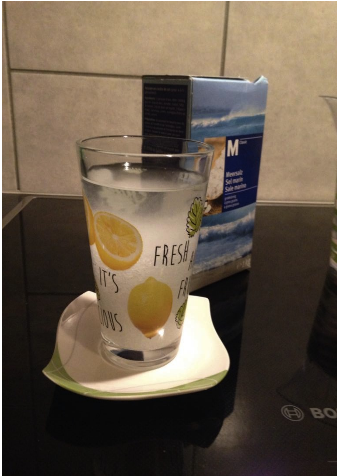
Illustration 4: Verre placé sur une soucoupe

3ème étape : Placer le verre sur la soucoupe, ceci afin de protéger du débordement du sel. (Si si il va sortir!)